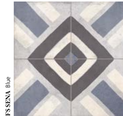
FS SENA Blue